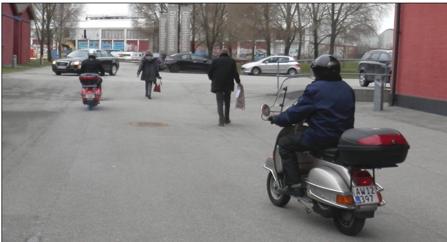
Farvel og på gensyn på de næste arrangementer