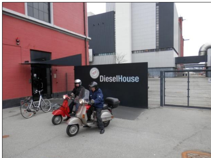
Deltagerne er ankommet til DieselHouse