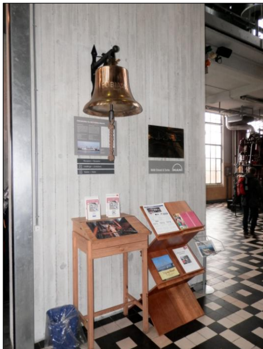
Skibsklokke og brochurepult