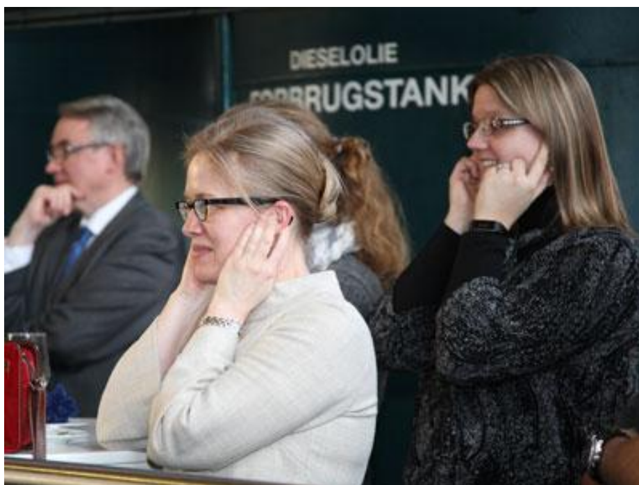
Publikums reaktion på larmen under opstart og drift i tomgang