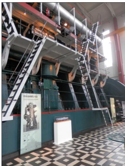
B&W dieselmotoren set fra gulvet