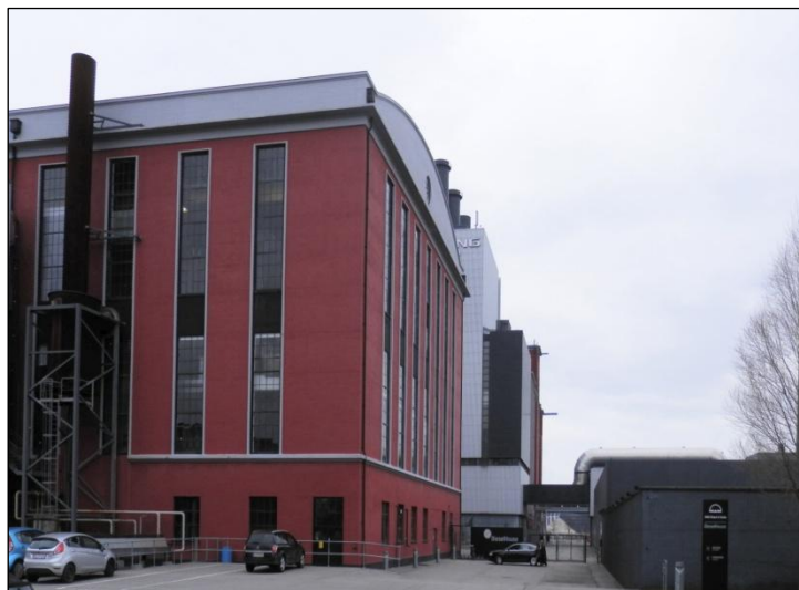
Ørstedværkets store bygning der rummer museet